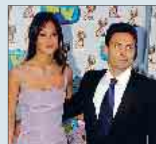
Toffanin con Berlusconi jr.