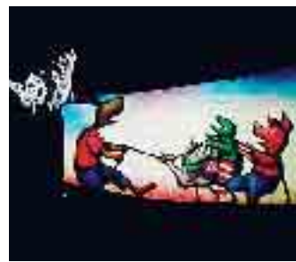
Una scena di "Ranocchio" di Gioco Vita