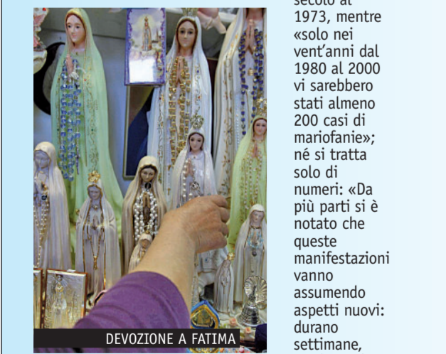
DEVOZIONE A FATIMA

Oltre 500 apparizioni della Madonna nel solo Novecento. È il dato offerto dalla voce «apparizioni» nel nuovo dizionario di «Mariologia» curato da padre Stefano De Flores, dalla teologa svizzera Valeria Ferrari Schieler e da padre Salvatore M. Perrella per la San Paolo (pp. 1342, euro 150). Cifre che lo stesso don Gianni Colzani, teologo autore della voce, definisce «impressionanti»: un primo censimento ha contato infatti ben 295 manifestazioni della Vergine dall'inizio del secolo al