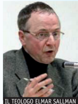
IL TEOLOGO ELMAR SALLMANN

Luigi dal volersi porre in concorrenza con le scienze naturali, Salmann ha proposto una chiave di lettura dell'universo alternativa, quella dell'empatia. «Prendere coscienza che il mondo è una Creazione richiede da parte nostra un'attività interpretativa e una grande apertura, una «sua apertura ad Altro da sé». L'esserci del mondo «si deve a una parola, a un intervento, a una Presenza». Per questo l'uomo che lo abita e abita con lui, «un'apertura ad Altro da sé». Più che artigiano o produttore - fa notare il teologo - Dio nella Genesi è presentato come una sorta di artista della parola. «Disse» e «fu» sono le azioni che descrivono la Creazione.